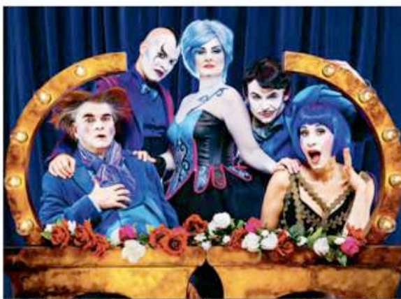
Le quintette interprète le répertoire lyrique avec un ton totalement débridé.

«La Traviata» (Verdi), «La flûte enchantée» (Mozart) et «Carmen» (Bizet) ont été les opéras les plus joués entre 2011 et 2016.