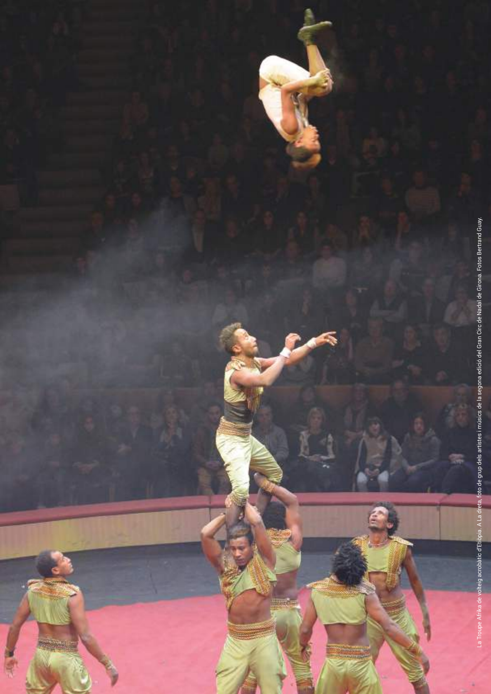
La Troupe Afrika de volteig acrobàtic d'Etíopia. A La dreta, foto de grup dels artistes i músics de la segona edició del Gran Circ de Nadal de Girona.