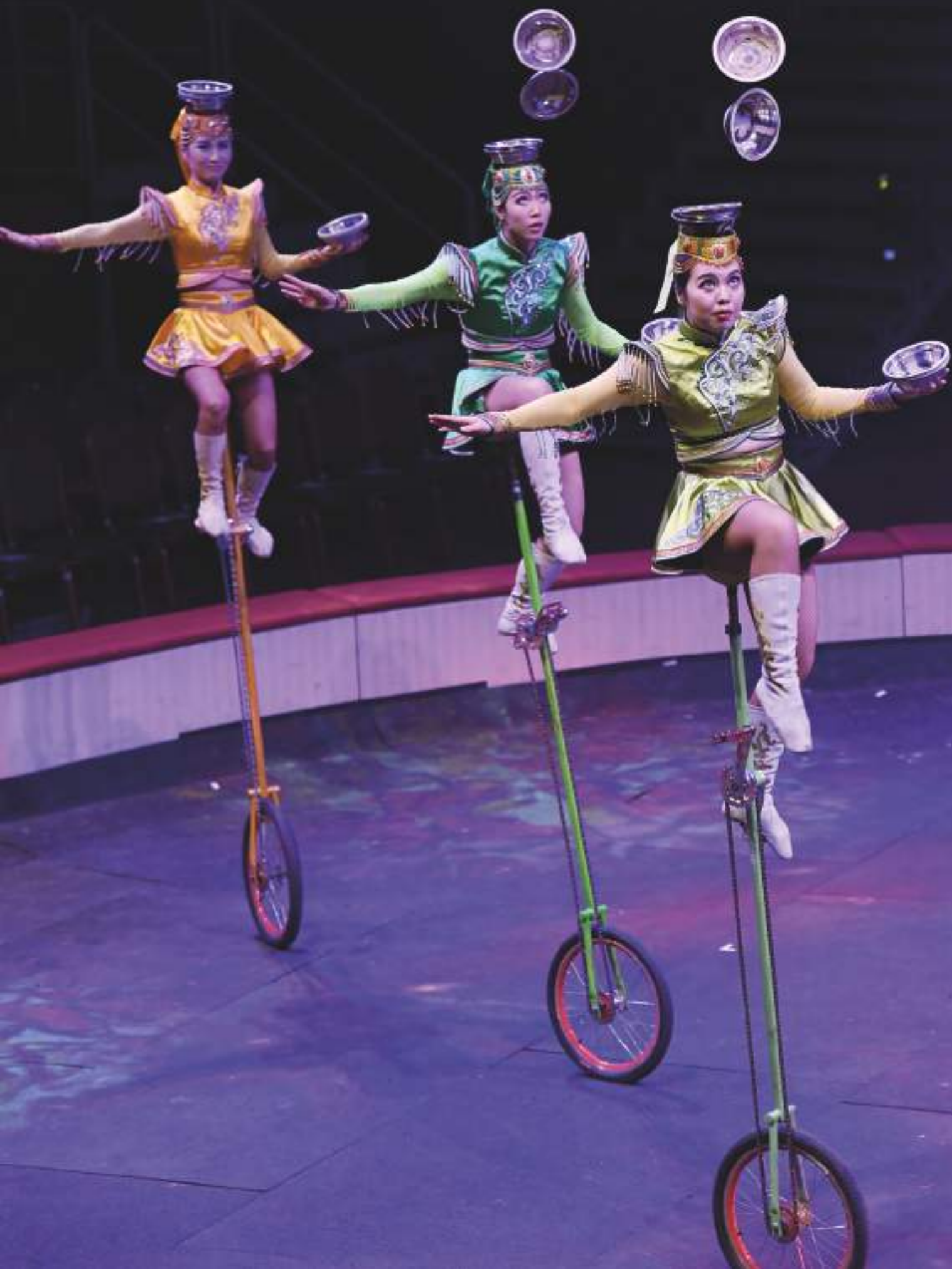
Tres de les cinc monociclistes de la troupe Hohhot de Xina, participants a l'espectacle "Orient" del Gran Circ de Nadal de Girona.