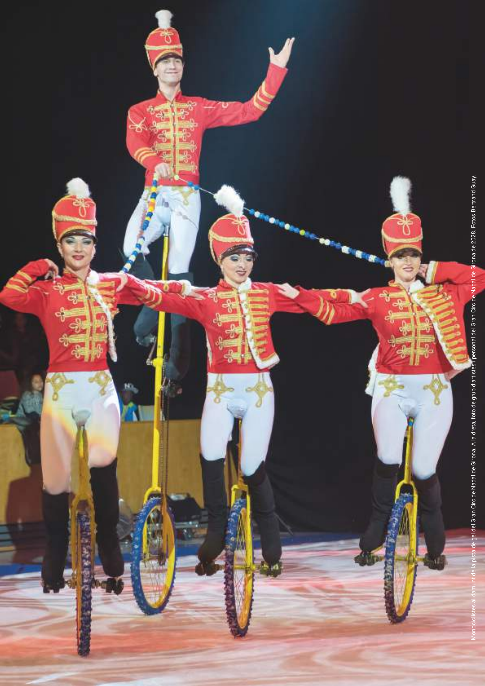
Monociclistes al davant de la pista de gel del Gran Circ de Nadal de Girona. A la dreta, foto de grup d'artistes i personal del Gran Circ de Nadal de Girona de 2028.