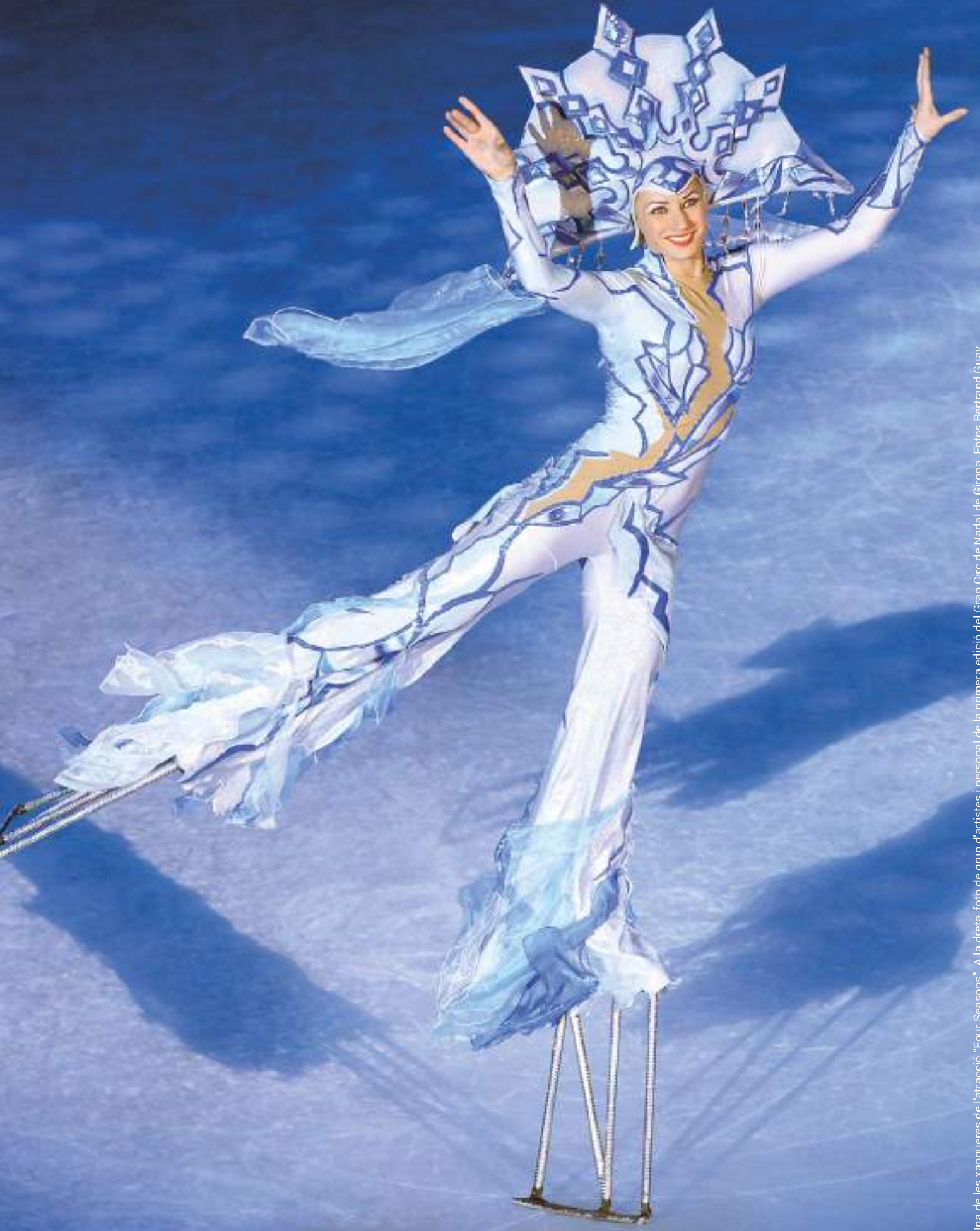
Una de les xanqueres de l'atracció "Four Seasons". A la dreta, foto de grup d'artistes i personal de la primera edició del Gran Circ de Nadal de Girona.